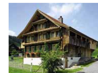
Abb. 1 Haus Unterblacki nach dem Umbau, Ansicht von Nord-osten: Dank einem umsichtigen Umbaukonzept konnte die ursprüngliche Grundrisstruktur und viel von der originalen Bausubstanz bewahrt werden