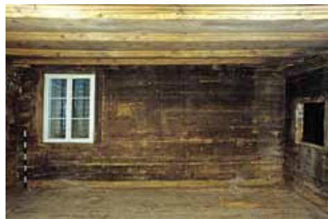
Abb. 4 Haus Unterblacki, Blick in die Stube mit repräsentativer Bohlen-Bälkchen-Decke: An der Wand sind vertikale Schmutznegative des Brettertäfers aus dem frühen 17. Jahrhundert und das ältere, horizontale Standnegativ der Eckbank sichtbar. Auf der Blockwand klebt der Einblattdruck mit der Darstellung der «Sieben Schmerzen Mariens»