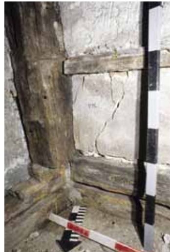
Abb. 10 Haus St.-Oswalds-Gasse 10, erstes Obergeschoss, Raum 10, Südwestecke: Der originale Ständer ist mit Fase und auslaufendem Schildchen verziert. Er ist in die südliche Aussenschwelle eingezapft, in welche die Schwelle der ehemaligen Westwand des Raumes stösst. Während die Bodenbretter unter dieser durchlaufen, sind sie in der Aussenschwelle eingefalzt. Über der Oberkante des bereits entfernten Mörtelgusses sind die Nuten zur Aufnahme der Bodenbretter sichtbar