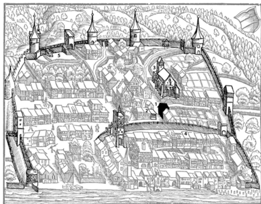
Abb. 6 Darstellung der Stadt Zug, Chronik des Johannes Stumpf (1547): 1 Haus St.-Oswalds-Gasse 10 (1447d), 2 Haus Kolinplatz 21 (1448d), 3 Kirche St. Oswald (1478–1483/84), 4 Ring- und Zwingermauer (13./14. Jh.), 5 Äussere Stadtmauer (1478–1528)

gen angeordnete Treppen mit dem ersten Wohngeschoss verbunden sind. Unter dem Dachfirst zentriert ist eine weitere Kammer eingebaut. Beidseitig dieser Firstkammer ergeben sich sogenannte Schlüpfе. Der Stauraum über der Eckkammer und die beiden Schlüpfе dürften mittels Leitern von den Treppenpodesten aus bedient worden sein. Die Firstkammer selbst ist seitlich über einen Schlupf zugänglich.