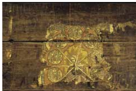
Abb. 5 Haus Unterblacki, Stubensüdwand: Auf dem Einblattdruck aus dem 16. Jahrhundert sind die «Sieben Schmerzen Mariens» dargestellt