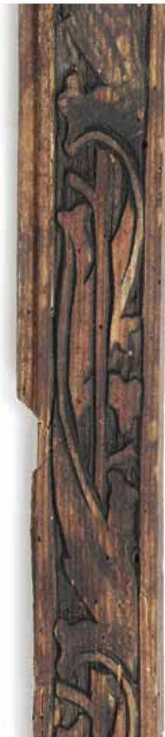
Abb. 12 Haus St.-Oswalds-Gasse 10, erstes Obergeschoss, Raum 15: Die flachgeschnittene, bemalte Zierleiste (hier hochgestellt) mit Akanthusranke und Mittelstab (1510/20) war an der Unterseite des Himmels der Nische des Nordfensters angebracht.