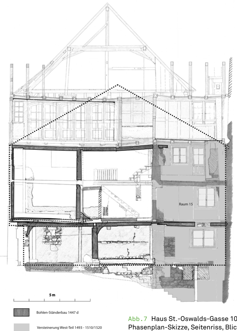
Abb. 7 Haus St.-Oswalds-Gasse 10, Phasenplan-Skizze, Seitenriss, Blick nach Süden: Phase 1: Bohlen-Ständerbau 1447d (dunkelgrau), Phase 2: Versteinerung bis 1510/1520 (hellgrau)

Bedingt durch die Konstruktion entstand über dem isolierenden und brandschützenden Mörtel Estrich ein Hohlraum Abb. 11. In diesem hatten sich unzählige unterschiedlichste Gegenstände (Zwischenbodenfunde) angesammelt, die über die Jahrhunderte zwischen die Ritzen der Bodenbretter gefallen sind. Besonders interessant sind die zahlreichen Münzen, 41 an der Zahl, und die über 600 Lederschnipsel. Aufgrund der Auswertungen der Bausubstanz und der Funde kann man einerseits nachweisen, dass diese Estriche zu unterschiedlichen Zeitpunkten eingebracht wurden, nämlich um 1447 und 1480, andererseits, dass hier eine Schuhmacherwerkstatt eingerichtet war: Die Untersuchung der Lederschnipsel sowie die Analyse von im Haus geborgenen Fragmenten des Einnahmen- und Ausgabenverzeich-