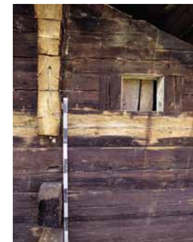
Abb. 2 Haus Unterblacki, Ansicht an das Giebfeld der noch nicht renovierten Hauptfassade: Unter dem originalen Heiterloch ist der Fenstergurtbalken mit farbllichem Negativ eines abgebeilten Zierfrieses erkennbar. Durch das Zurücksägen der Vorstösse der Firstkammerwand wurde ein Dübel wieder sichtbar

und, von dieser her erschlossen, eine kleinere Kammer (Nebenstube) eingerichtet. Die beiden Hauseingänge führen ins ebenerdig angelegte Hinterhaus. Es ergibt sich entlang der Querwand eine Art Zirkulationsachse. Dieser Hausbereich wird von einer kleinen Eckkammer und der zum Gang hin nicht abgetrennten Küche eingenommen. Die ursprüngliche Herdstelle konnte an der rückwärtigen Giebelfassade lokalisiert werden. Rauch- und Russablagerungen an den bis ins 18. Jahrhundert nicht verkleideten Innenwänden zeugen von einer bis unter das Dachgebälk offenen Rauchküche. Hier zog der Rauch der Herdstelle und des Ofens in der Stube unkanalisiert zwischen der rückwärtigen Giebelwand und dem Dach ins Freie ab. Im zweiten Wohngeschoss gibt es im Vorderhaus zwei Kammern Abb. 3 . Auf dieser Wohnebene besteht zudem, über der Eckkammer im ersten Wohngeschoss angeordnet, eine zweite Eckkammer mit wenig grösserem Grundriss. Die Räume und die Lauben im zweiten Wohngeschoss werden über Podeste erreicht, die über zwei gegenläufig zu den Hauseingän-