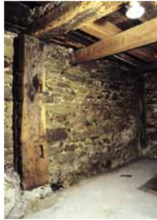
Abb. 8 Haus St.-Oswalds-Gasse 10, Erdgeschoss, Südwand: Auf dem originalen Mittelständer liegt der Unterzug auf. Die vertikale Nut im Ständer und das Kopfholz auf der Ständeraussenseite sind noch vorhanden. Sekundär sind der Steinsockel und das Fundament unter dem Ständer sowie die von aussen an den Bohlen-Ständerbau gemauerte Steinwand, in der horizontale Negative von Wandbohlen sichtbar sind