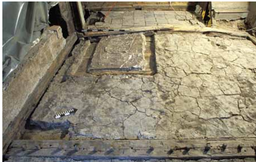
Abb. 11 Haus St.-Oswalds-Gasse 10, erstes Obergeschoss, Raum 10: Auf dem originalen Lehm Mörtel Estrich, in dem das Negativ des Ofenfundaments noch sichtbar ist, lagerten zahlreiche Funde

Baukörper ragte im Osten rund 1 m über den unteren hinaus und hatte mit mehr als 122 m 2 einen enorm grossen Grundriss. Im ersten Obergeschoss wurde diese Grundfläche durch eine vermutete Laube auf der Westseite sogar noch vergrössert. Das Erdgeschoss bestand wohl aus einem einzigen, hallenähnlichen Raum. Die beiden Obergeschosse gliederten sich in drei gleiche Teilbereiche: Im Ostteil gab es zwei Räume, deren Wände zum durchgehenden Mittelteil etwas versetzt waren. Der Westteil umfasste zwei weitere Kammern. Die Zimmer waren jeweils vom gangartigen Mittelteil her durch Türen erschlossen Abb. 7.